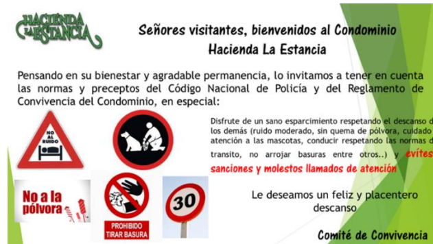
APOYO JUEVES 28 DE ABRIL DE 2024 – INICIO SEMANA SANTA

Continuamos con las Campañas de concientización, especialmente, durante los fines de semana festivos y en las fechas consideradas como temporada alta, con la entrega de volantes informativos en la portería No. 2 (ingreso de visitantes):